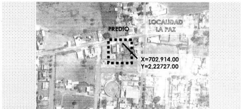
Contexto de localización del predio urbano, localidad la Paz delegación de Santa Fe, Zapotlanejo, Jalisco.

TERCERO. QUE SE HA IDENTIFICADO POR MEDIO DE LEVANTAMIENTO TOPOGRÁFICO EL PREDIO URBANO OBJETO DEL PRESENTE CON SUPERFICIE DE 480.01 m 2 CUATROCIENTOS OCHENTA PUNTO CERO UN METROS CUADRADOS CON LAS SIGUIENTES MEDIDAS Y COLINDANCIAS AL NORTE: CON ORIENTACIÓN DE PONIENTE A ORIENTE EN LÍNEA RECTA PARTIENDO DEL VÉRTICE NORTE Y PONIENTE CON RUMBO AL ORIENTE 8.81 METROS COLINDANDO CON AVENIDA 16 DE SEPTIEMBRE. AL ORIENTE: CON ORIENTACIÓN DE NORTE A SUR EN LÍNEA QUEBRADA PARTIENDO DEL VÉRTICE NORTE Y ORIENTE CON RUMBO AL SURESTE 27.77. CON RUMBO AL PONIENTE 2.32. CON RUMBO AL SUR 2.23 Y LA SURPONIENTE 13.59 METROS COLINDANDO CON J MIGUEL LOMELÍ VELASCO. AL SUR: CON ORIENTACIÓN DE ORIENTE A PONIENTE EN LÍNEA RECTA PARTIENDO DEL VÉRTICE SUR Y ORIENTE CON RUMBO AL PONIENTE 8.78 METROS COLINDANDO CON RAMÓN VELASCO GARCÍA. AL PONIENTE: CON ORIENTACIÓN DE SUR A NORTE EN LÍNEA RECTA EN VARIAS MEDIDAS PARTIENDO DEL VÉRTICE SUR Y PONIENTE CON RUMBO AL NORTE 12.77. 10.70. 11.53 7.35 METROS COLINDANDO CON GERARDO GÓMEZ TOSCANO.